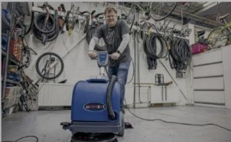
• Ondernemers stak en tijdens NLDoet de handen uit de mouwen bij maatschappelijke organisaties.

* Maatschappelijk betrokken ondernemen is ondernemen met als doel een positieve impact te maken op mens, maatschappij en milieu, door bij te dragen aan concrete oplossingen voor lokale maatschappelijke vraagstukken.